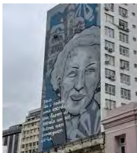
Figura 2 – Mural em grafite de Helena Kolody, Praça Generoso Marques.