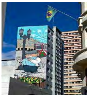
Figura 1 – Mural em grafite de Poty Lazarotto, Rua XV de Novembro.

se torna interessante economicamente, apropriar-se da mesma. Para um processo que culmina no aumento da produção de capital, além de descaracterizar uma parte importante do movimento, esses holofotes não são acompanhados de políticas efetivas que buscam findar a segregação socioespacial ou a negação do direito à cidade para essa população. Como diz o cantor Djonga: “Cagando pontes para a classe média culpada que agora quer colar com nós, tem que ter muito sangue frio e eu não tenho para apertar a mão do seu próprio algoz” . Enquanto o capital guiar quem ou o que deve existir em determinado espaço, a arte que escancara uma realidade será sempre um inimigo.