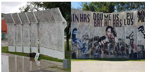
Figura 3 – Antes e depois do mármore apagado pela prefeitura, na Praça Afonso Botelho.

* Estudante do 4º ano do curso Técnico Integrado em Administração no IFPR, campus Pinhais. Bolsista do projeto Uso e ocupação da área central de Curitiba: mudanças estruturais e sociais a partir do programa Rosto da Cidade.